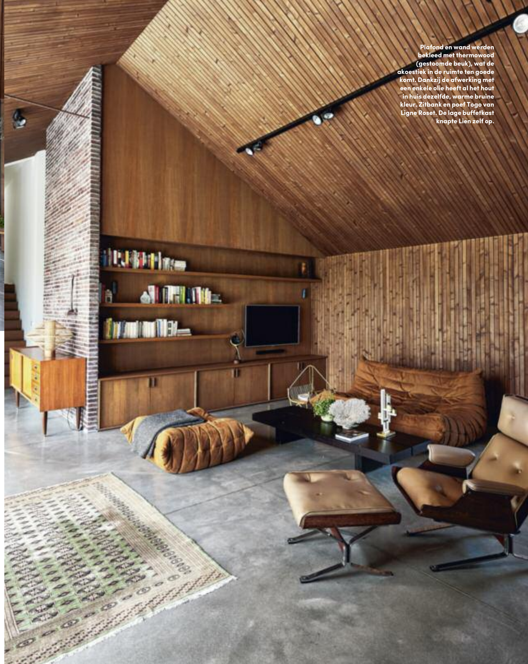
Plafond en wand werden bekleed met thermowood (gestoomde beuk), wat de akoestiek in de ruimte ten goede komt. Dankzij de afwerking met een enkele olie heeft al het hout in huis dezelfde, warme bruine kleur. Zitbank en poef Togo van Ligne Roset. De lage buffetkast knapte Lien zelf op.

Het is opvallend hoe vanzelfsprekend de woning in het landschap opgaat, zeker als je bedenkt dat het gezin er nog maar woont sinds begin vorig jaar. "Het was de bedoeling om de gebruikte materialen binnen en buiten zo mooi mogelijk te laten aansluiten bij de omgeving", legt Lien uit. Dat is aan de buitenzijde goed geslaagd dankzij het gebruik van de Kolumba-gevelsteen: een handgemaakte steen die ook gebruikt werd voor het pad tussen de twee gebouwen van de woning, zodat ze een geheel vormen. De tegelpannen van het dak sluiten er perfect bij aan. Ook de oriëntatie ►