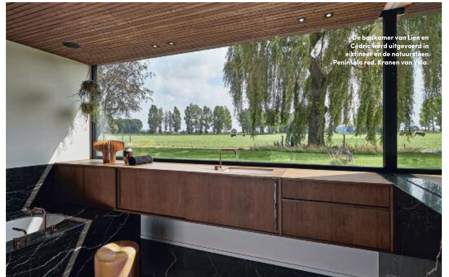
De badkamer van Lien en Cédric werd uitgevoerd in eikfineer en de natuursteen Peninsula red. Kranen van Yola.