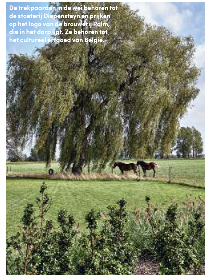
De trekpaarden in de wei behoren tot de stoeterij Diepensteyn en prijken op het logo van de brouwerij Palm, die in het dorp ligt. Ze behoren tot het cultureel erfgoed van België.